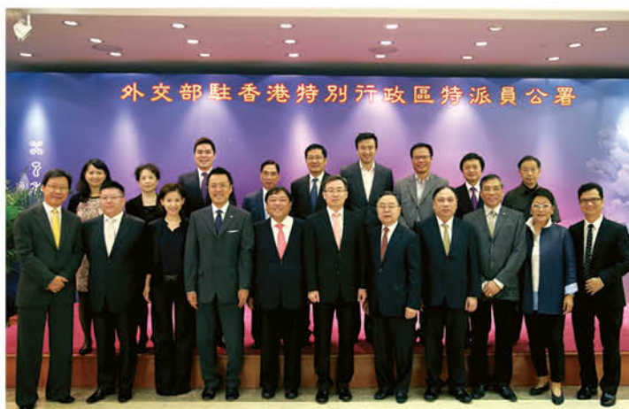
與外交部駐香港特別行政區特派員宋哲先生