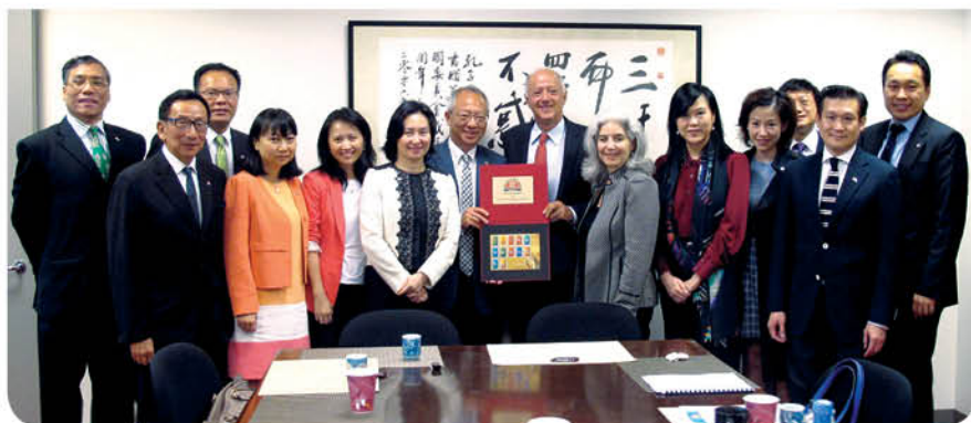
與美中關係全國委員會交流