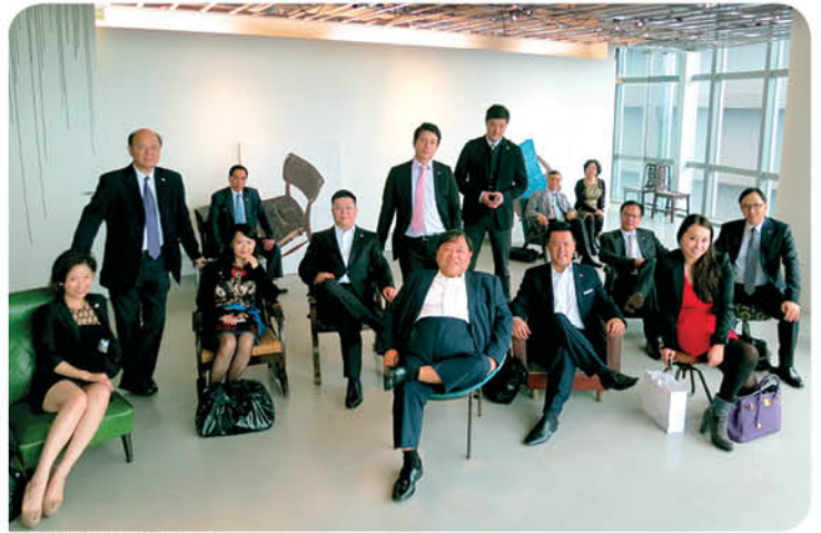
於學學文創志業的合照

為對台灣經濟及文化等範疇的未來發展有更多認識，以及進一步了解台灣的投資環境，「基金」於2013年4月16日至19日首次舉辦台灣訪問團，到訪台北市及台中市。訪問團分別與台北市及台中市市長、國民黨榮譽主席連戰先生、當地工商及文化界代表和智庫組織會面，為日後進一步的交流及合作奠下基石。是次訪問團更得香港經濟貿易文化辦事處及香港台北經濟文化辦事處的支持及協助。