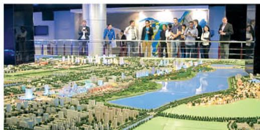
參觀南昌國家高新技術開發區