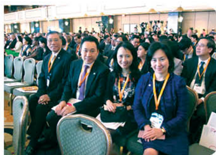
出席於紐約舉行的「邁向亞洲首選香港」會議