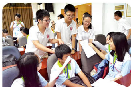
哈爾濱市第三中學的學生教香港同學說東北話