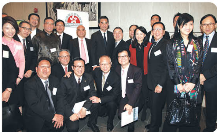
「基金」成員與行政長官梁振英先生合照