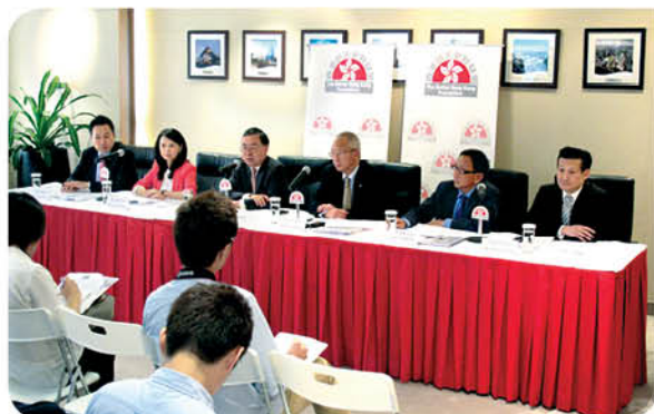
完成訪美之後，於6月26日在香港舉行記者會