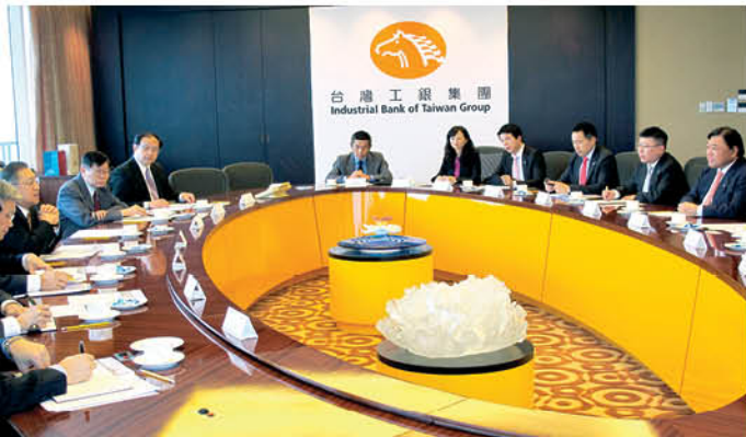
與中華民國工商協進會代表會面