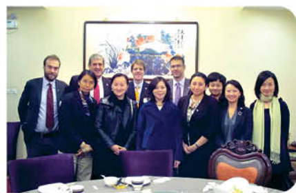
香港特區政府駐京辦主任朱曼鈴女士(中)設午餐宴歡迎訪問團