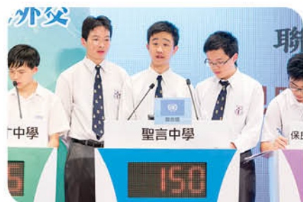
聖言中學連續兩年奪冠