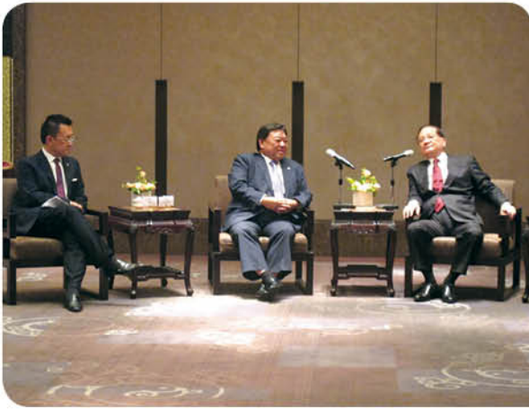
「香港明天更好基金」台灣訪問團