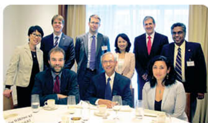
市區重建局主席蘇慶和先生(前排中)設午宴款待訪問團