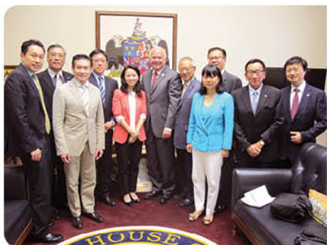
與國會議員Jo Bonner 先生