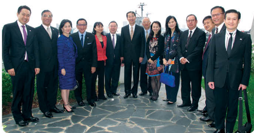
中國駐紐約總領事孫國祥大使(左七)於使館設午宴款待訪問團