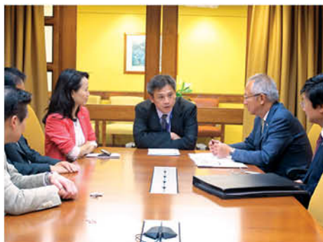
與美國國務院 副助理國務卿Kin Moy先生(中)交流