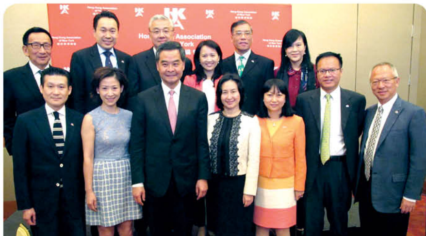
出席香港紐約協會為行政長官梁振英先生(前排左三)舉辦的早餐會

於紐約期間，訪問團參加了由香港貿易發展局舉辦的「邁向亞洲首選香港」會議及香港晚宴等活動。此外，訪問團應香港駐紐約經濟貿易處的邀請出席由行政長官梁振英先生主禮的酒會，慶祝該處成立三十週年誌慶。在完成華盛頓之行後，七名訪問團成員繼續前往洛杉磯，參與於當地舉行之「邁向亞洲首選香港」會議。他們亦獲邀出席由香港駐三藩市經濟貿易處舉辦的午宴以及香港旅遊發展局為推廣香港旅遊而舉辦的一系列活動。