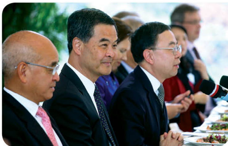
「香港明天更好基金」與各國駐港總領事及商會領袖新春午宴

於10月第四屆中美記者交流計劃，「基金」安排七名美國記者訪問北京、南昌及香港，讓他們親身體驗香港及中國內地的發展情況。透過地方採訪及與當地民眾接觸，記者們可以從不同角度探討了解香港及中國。