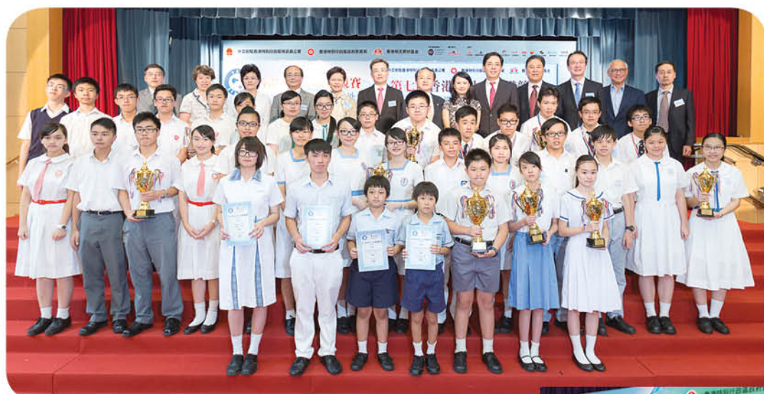
總決賽於7月6日成功舉行

於8月9日至16日期間，大會特別安排優勝及入圍總決賽的隊伍及其老師訪問北京及哈爾濱。透過競賽，我們希望香港的青少年及公眾對中國，特別在國際外交上更感興趣。