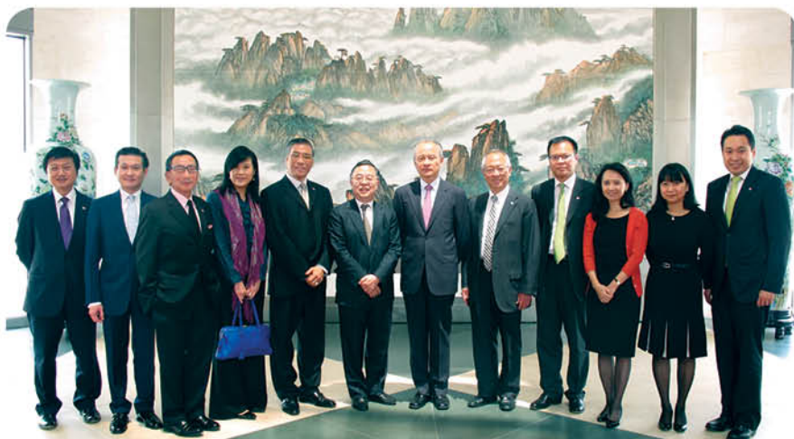
中國駐美國大使崔天凱大使(右六)於大使館設宴款待訪問團