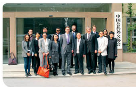
與中國公共外交協會副會長馬振崗大使(前排右四)會面

透過與地方當局和不同社區的直接對話，以及親身接觸和了解各方發展，美國記者對香港及中國內地的當前形勢和未來發展都有更深的認識。