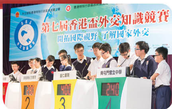
準決賽於5月18日舉行，16隊入圍隊伍爭奪總決賽席位