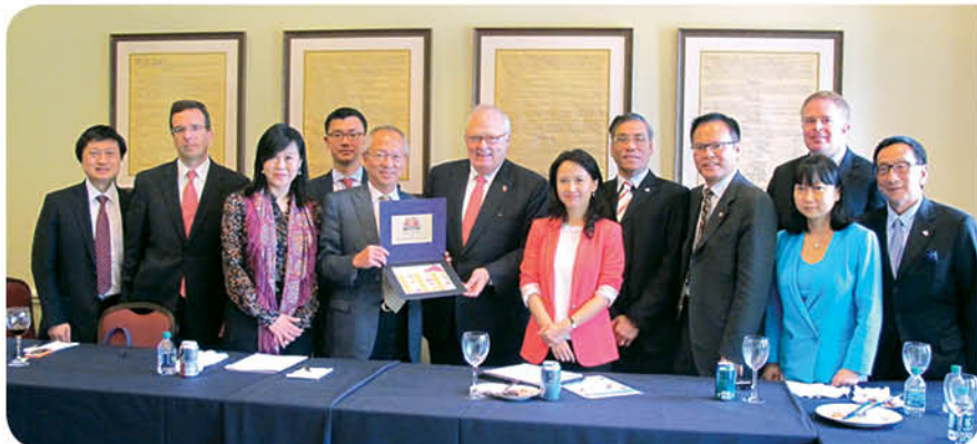
美國傳統基金會設午宴款待訪問團，並由其創會人Edwin Feulner博士主持