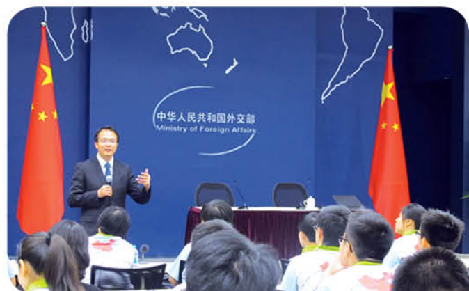
外交部發言人洪磊先生於外交部新聞發佈廳一藍廳與學生分享工作上面對的挑戰