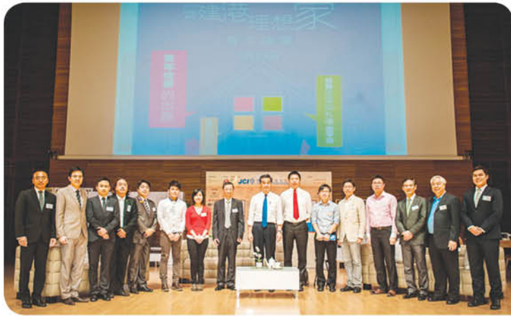
理事余偉傑先生(右一)代表「基金」與行政長官梁振英先生(右八)及其他嘉賓合照留念