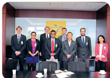
與立法會主席曾鈺成議員(右三)會面