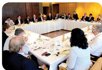
Vision 2047 Foundation為訪問團設早餐會議