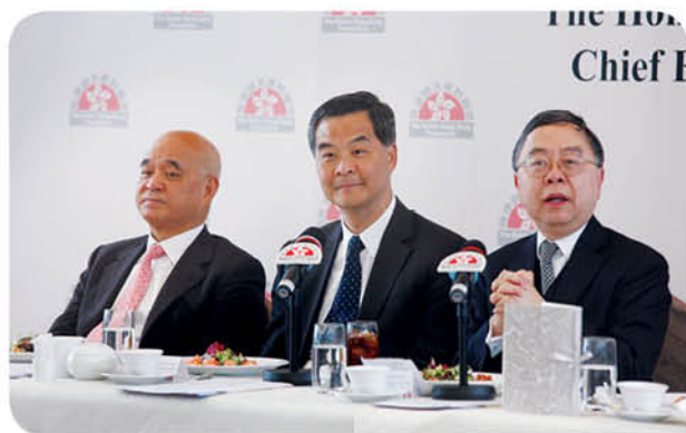
執行委員會主席陳啟宗先生(右)與顧問委員會主席鄭家純博士(左)代表「基金」歡迎行政長官梁振英先生