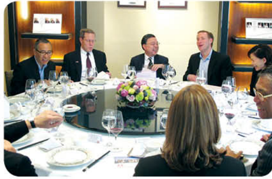
與美國國會議員幕僚訪問團