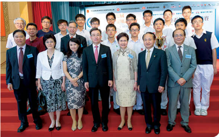
第七屆香港盃外交知識競賽