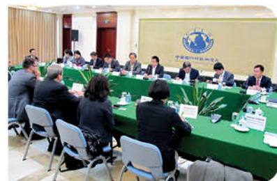
與中國國際問題研究所的專家交流