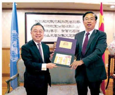
拜會中國常駐聯合國副代表王民大使(右)