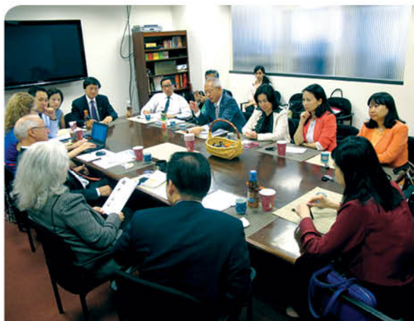
「香港明天更好基金」2013年訪美國