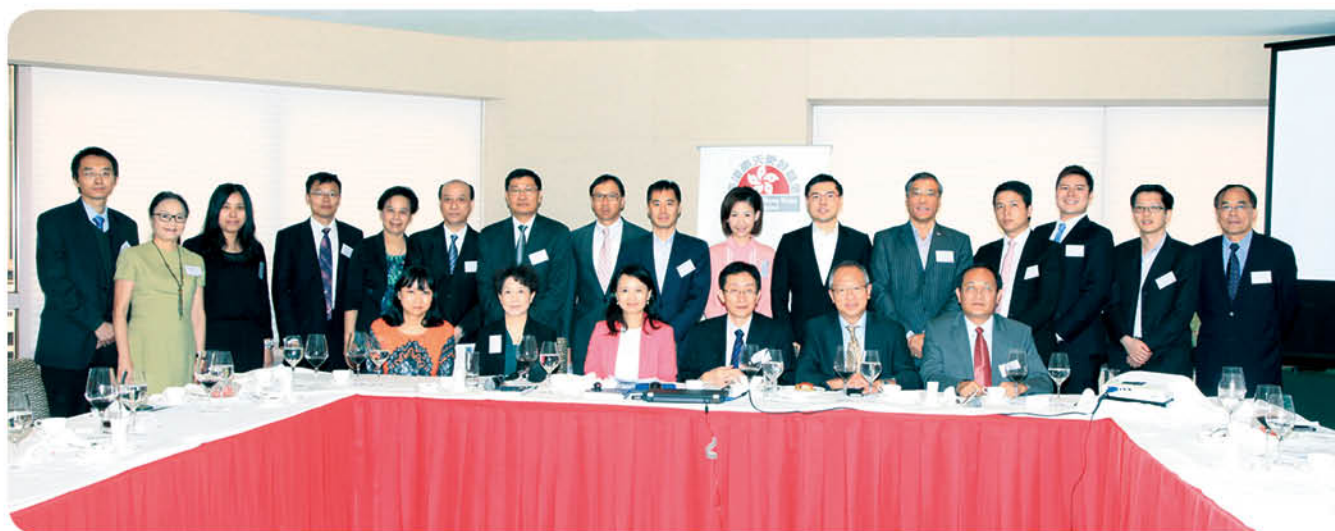
午餐研討會於新聞發佈會前舉行，讓「基金」成員與多位嘉賓就報告內容交換意見及看法