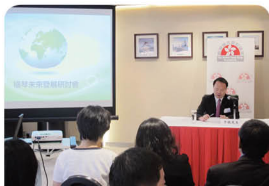
牛敬先生介紹橫琴的未來發展