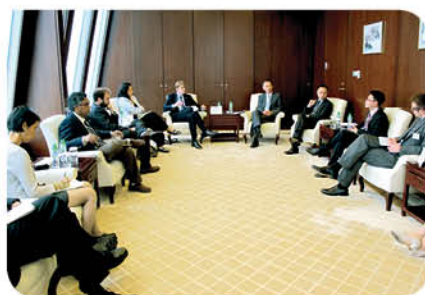
到訪香港金融管理局