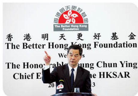
行政長官梁振英先生認為香港是服務內地市場的樞紐