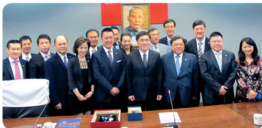
與台北市市長郝龍斌先生(前排右四)會面