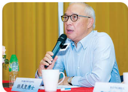
恒生銀行董事長錢果豐博士應「基金」之邀擔任總決賽評判