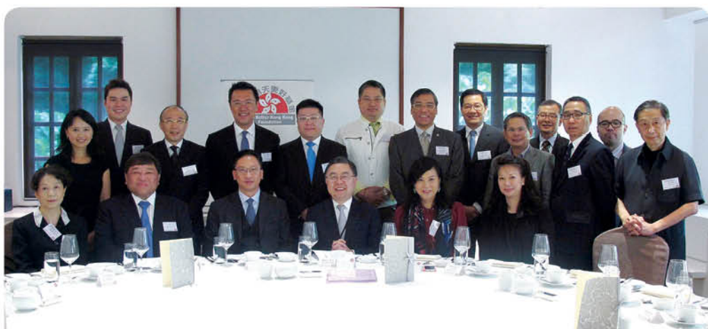
與律政司司長袁國強先生

今年繼續保持首位。香港擁有其獨特優勢，尤其作為“超級連繫人”，向全球及中國提供資金、人才及獲國際肯定的工商制度。於五月「基金」的午餐會上，律政司司長袁國強先生亦表示香港極具潛力發展成為亞洲地區的仲裁及調解中心。不過，我們不應只滿足於現狀，而應主動爭取及把握機會，為中國的未來及繁榮，積極參與及貢獻。