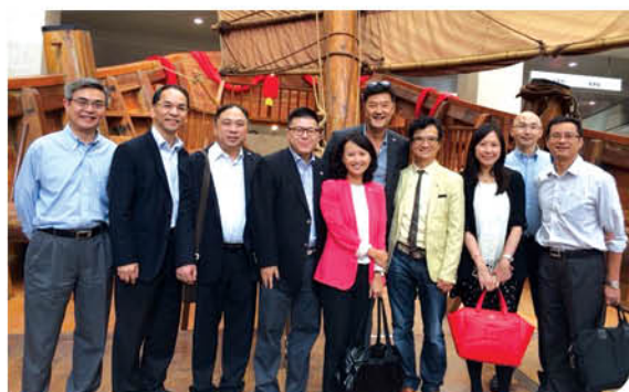
參觀上海航海博物館