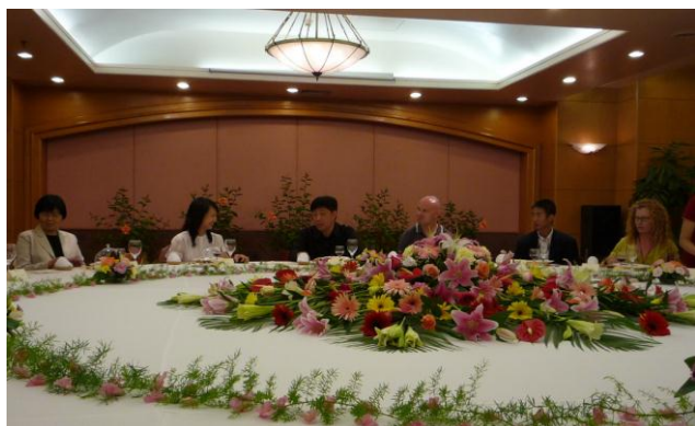
昆明省副省長顧朝曦先生(左三)設午餐宴款待訪問團