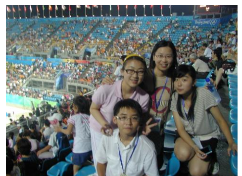
觀看奧運沙灘排球賽

訪問團特別感謝外交部及外交學院的熱情款待。有關團員旅程後之感想，可瀏覽外交部駐香港特區特派員公署網頁 http://big5.fmprc.gov.cn/gate/big5/quiz.fmcoprc.gov.hk/chn/ 。