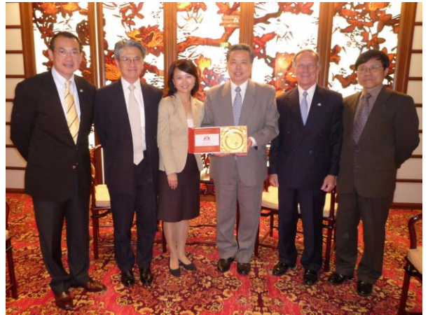
鄧淑德女士致送紀念品予彭克玉總領事（右三）及鄺偉林副總領事（右一）