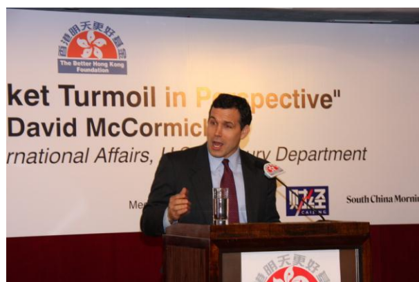
McCormick 副部長向與會者分享其對近期全球金融動盪的看法和出路

午餐會中，McCormick 分析了今次市場動盪的主要成因、介紹美國政府就減少風險以及穩定市場所採取的措施，以及一些美國和中國政府應可及早吸取的教訓。針對現時情況，他提出了四大應變方案