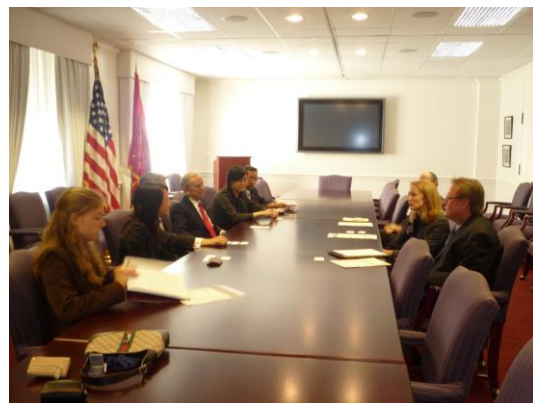
與美國商務部會面

Studies)、「卡內基國際和平基金會」(Carnegie Endowment for International Peace)、「凱托研究所」(The CATO Institute)、「美國傳統基金會」(Heritage Foundation)、「東西方中心」(The East-West Center)、「美亞協會」(U.S.-Asia Institute)等；紐約的智庫如「美中關係全國委員會」(National Committee on U.S.-Asia Relations)、「亞洲協會」(Asia Society)等；專業團體「美國律師協會」(American Bar Association)；金融機構「摩根士丹利」(Morgan Stanley)；評級機構「標準普爾」(Standard & Poor's)以及多位傳媒代表等。