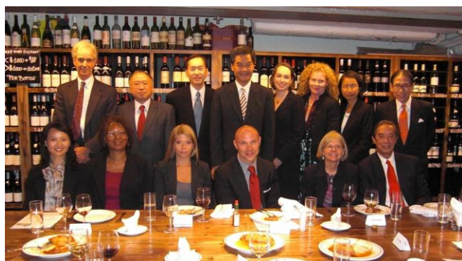
多位行政會議成員亦抽空出席了由梁振英先生安排的午餐會