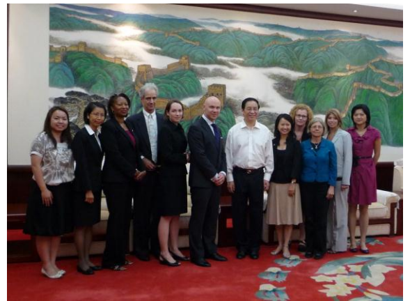
與中國銀行業監督管理委員會劉明康主席(右六)會面

在前往中國之前，記者們於檀香山先參加一系列的研討會，由熟悉中國和香港事務的專家簡介兩地的狀況。在中國外交部的協助下，「基金」籌辦了中港兩地的訪問行程。於9月16日，訪問團抵達北京並正式展開訪中之旅。為了讓記者們感受一下中國首都北京的氣息，我們先安排了一天的觀光行程，遊覽了長城、故宮、天安門、國家大劇院等具代表性的地方。無論對古樸的歷史建築物或是嶄新的現代建設，團員都大為欣賞及讚嘆。