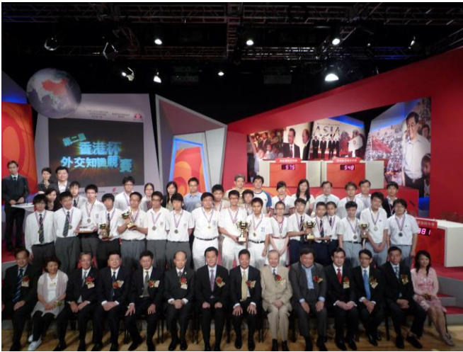
嘉賓與獲勝隊伍合照

國際關係史、國際國內時事、北京 2008 年奧運會、涉港外交及外交禮儀，全面考驗參賽學生的知識面與臨場應變能力。