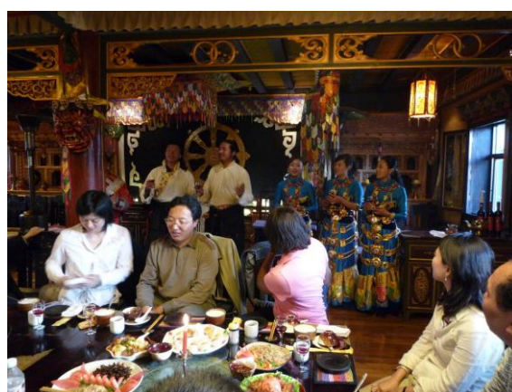
於齊紮拉書記所設的晚宴上，藏民以藏曲向各團員送上祝福

所吸引。於香格里拉，佛教是甚具影響力的宗教。因此，訪問團參觀了噶丹松贊林寺和雲南佛學院迪慶州分院，以了解當地僧侶的生活和教育方式。而迪慶藏族自治州州委書記齊紮拉先生亦抽空與記者見面，回答有關城市規劃和發展、宗教、保存少數民族的文化、環境保育等政策問題。齊書記隨後更為訪問團安排藏式晚宴，席間更有當地的藏民以藏曲向各團員送上祝福。此外，訪問團亦參觀了普達措國家公園、霞給文化生態旅遊村、藏獒繁育基地、獨克宗古城、尼西鄉湯堆村、香格里拉高山植物園和香格里拉格桑花卉公司等多個地方。雖然在香格里拉只待了短短的三天，但訪問團卻體驗了中國在文化、風俗、少數民族、地理等方面的多樣性。