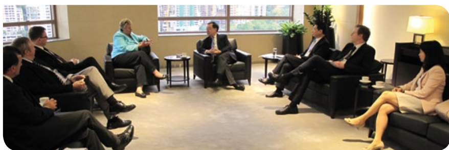
與英國跨政黨國會中國事務小組代表團會晤