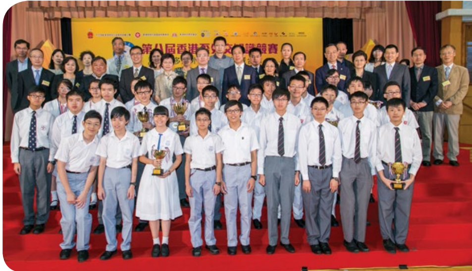
總決賽於2014年7月5日圓滿舉行

本屆競賽獲超過四千名中小學生報名參加。經過初賽及準決賽後，最後六強隊伍於7月5日出戰總決賽，爭奪金獎殊榮。比賽中，學生們相互比拼對中國外交事務、涉港外交、國家及國際時事、國際關係及外交禮儀等知識。