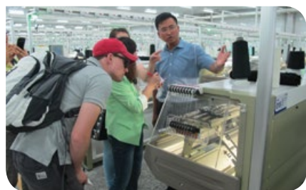
靈武羊絨工業園區