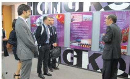
到訪香港特區政府駐京辦