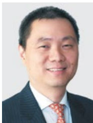
海通國際證券集團有限公司 林湧博士 副主席兼行政總裁 www.htisec.com

林湧博士現任海通國際證券集團有限公司副主席兼行政總裁。林博士持有西安交通大學經濟學博士學位，在投資銀行業擁有十八年經驗。他於1996年加入海通證券股份有限公司，曾任海通證券股份有限公司投資銀行部總經理。自2007年起，林博士擔任海通國際控股有限公司（前稱“海通（香港）金融控股有限公司”）行政總裁，負責海通證券股份有限公司海外業務的發展。2009年成功收購大福證券之後，林博士獲委任為海通國際證券集團有限公司執行董事及聯席董事總經理，並於2011年4月起開始擔任集團副主席兼董事總經理，亦為集團行政總裁。