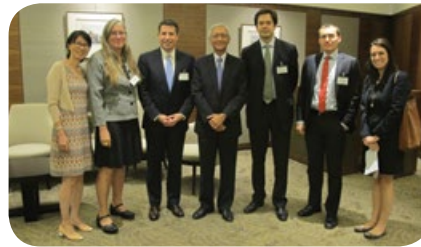
市區重建局主席蘇慶和先生(中)設午宴款待訪問團