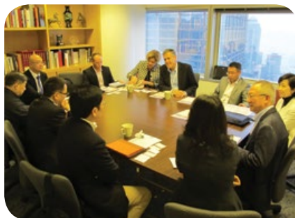
與以色列JVP Media Quarter代表交流