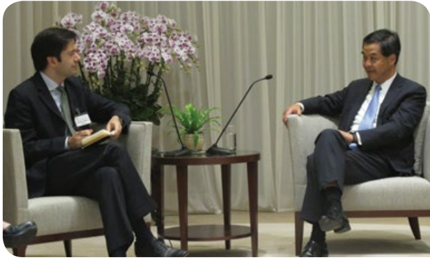
行政長官梁振英先生(右)接見訪問團