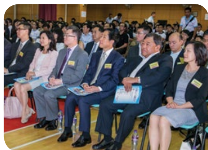
近三百名觀眾出席欣賞精彩賽事