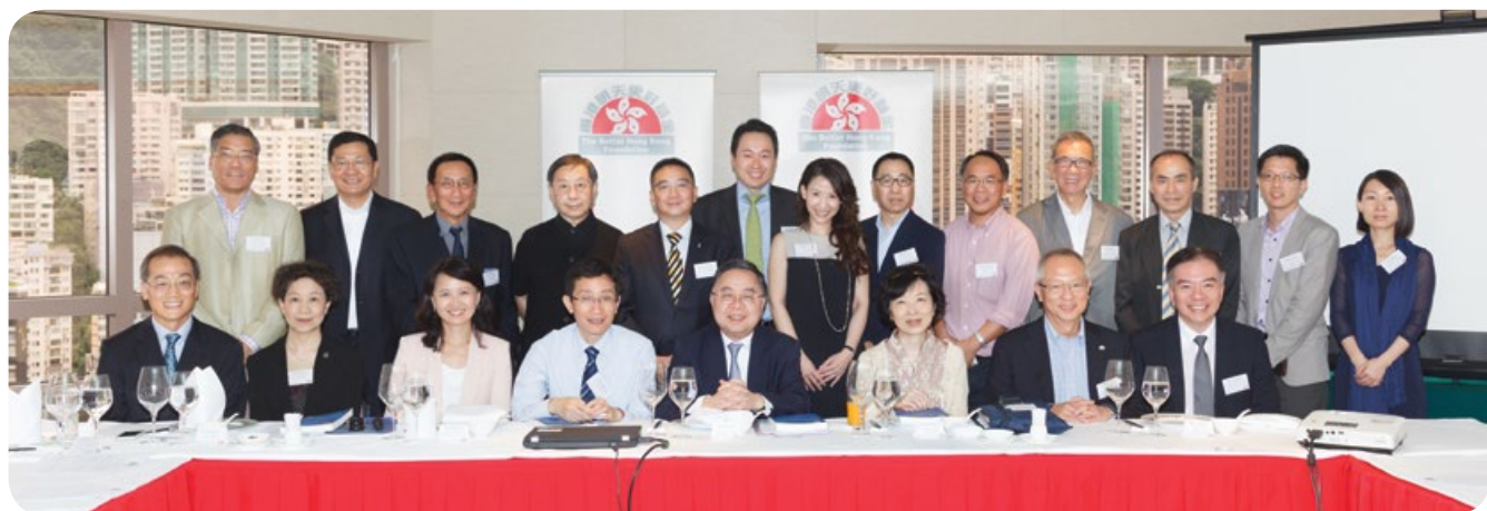
午餐研討會於新聞發佈會前舉行，讓「基金」成員與多位嘉賓就報告內容交換意見及看法