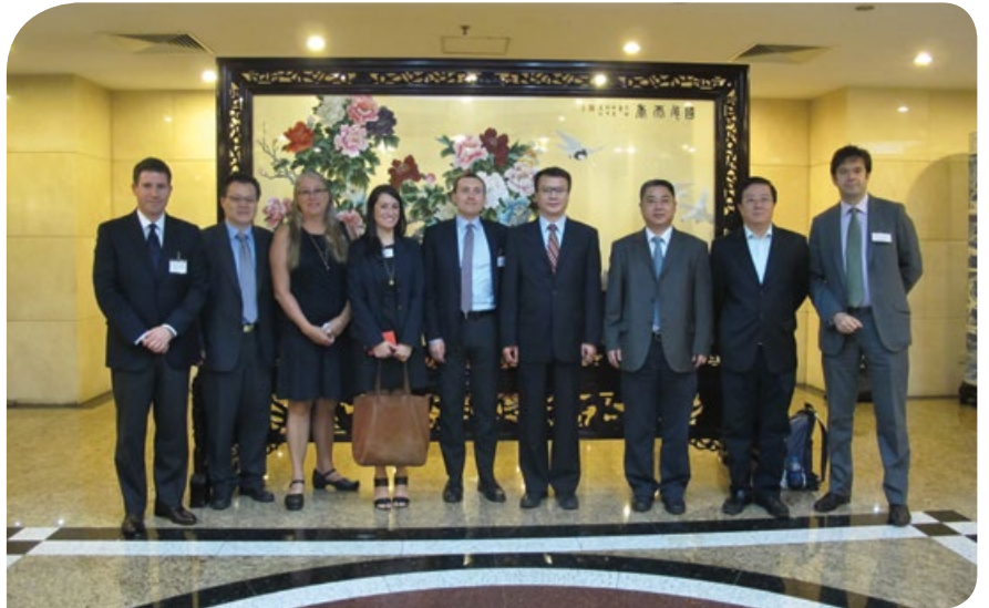
到訪國家發展和改革委員會

2014年9月14日至25日，由5名美國資深記者組成的訪問團訪問了北京、寧夏及香港。同時，5名中國記者也前