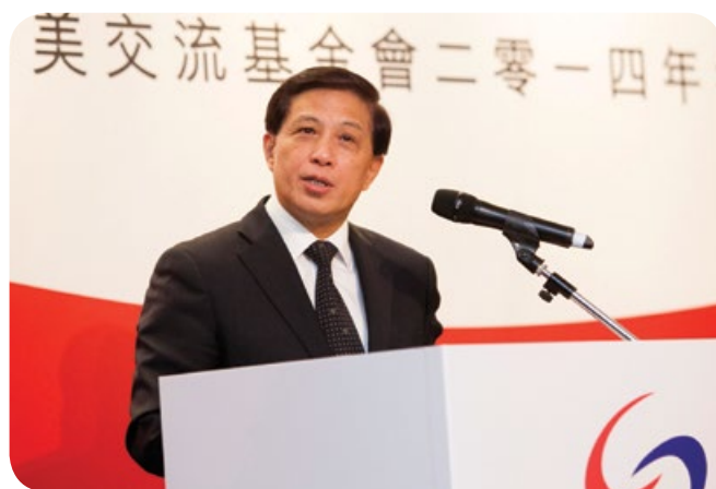
外交部副部長張業遂先生於貴賓晚宴上作主題演講

開幕辭。與會者對有關來年中美經濟的展望有更多的了解。論壇後，外交部副部長張業遂先生亦於貴賓晚宴上作主題演講。