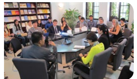
與清華大學新聞與傳播學院副院長及學生交流