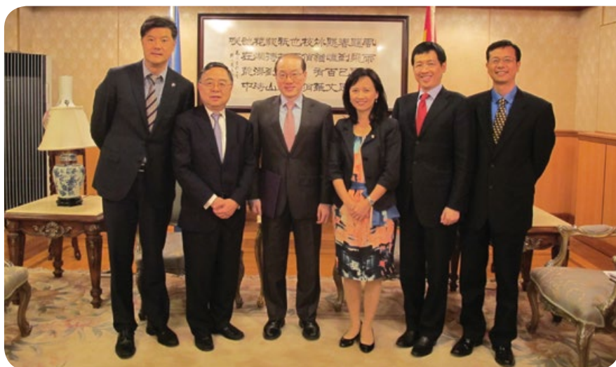
中國常駐聯合國代表劉結一大使(左三)接見訪問團