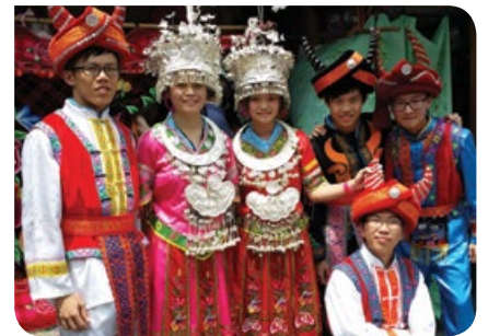
同學們穿上苗族傳統服裝