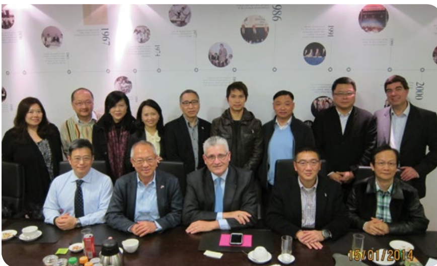
到訪以色列鑽石協會