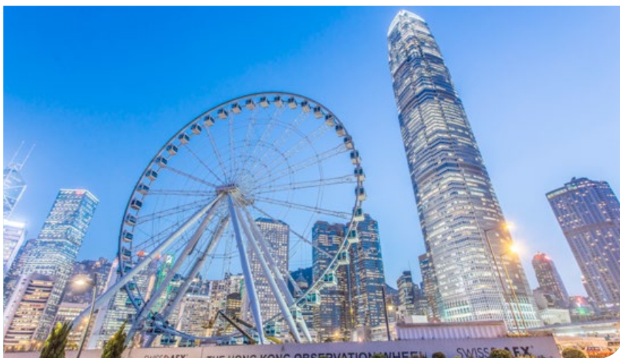
攜手共建美好香港