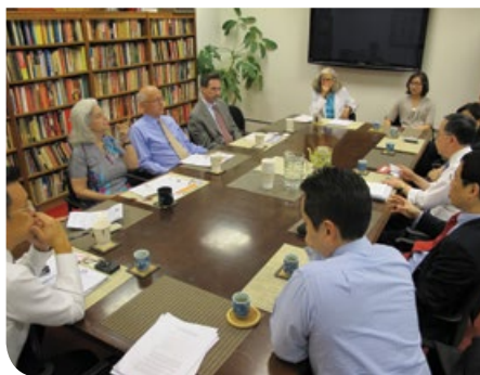
與美中關係全國委員會交流