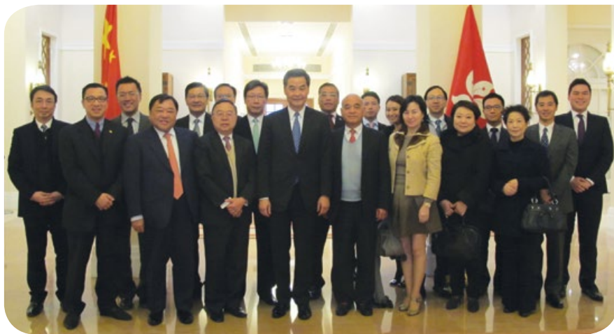
與行政長官梁振英先生會面

十一月份開通的《滬港通》為經濟帶來新刺激，是香港經濟發展的一個重要里程碑，正好為2014年作總結。它不單進一步加強香港作為國際金融中心及連繫中國內地與世界的“超級聯繫人”的地位，亦有助加快人民幣國際化的步伐。政制發展方面，香港是中國的特別行政區，獲授權於2017年以一人一票方式普選其行政長官，若有關選舉辦法獲市民大眾同意，並於立法會通過，就可落實推行。香港是一個言論自由開放的社會，當然有著不同的意見和聲音，最重要的是大家可以從中學習及改進，讓香港發展成為一個互諒互讓、彼此包容、更成熟文明的社會。事實上，大家都有著共同的目標，就是希望香港能成為更好的安居樂業的地方。尊重法治、社會穩定及言論自由都是香港賴以成功的基石，我們