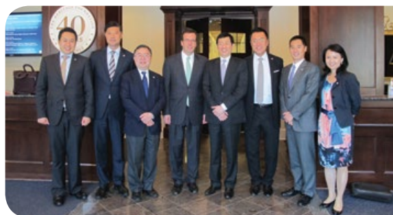
與美國傳統基金會交流