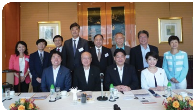
與日本香港友好議員連盟代表團見面