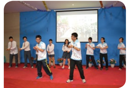
與博南高級中學的學生進行交流聯誼