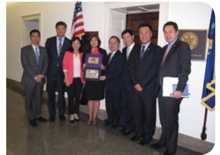
與國會議員孟昭文女士(左四)會面