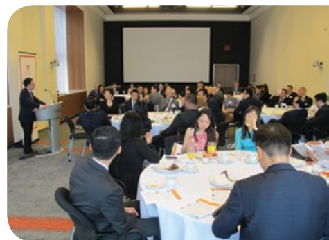
紐約香港協會早餐研討會