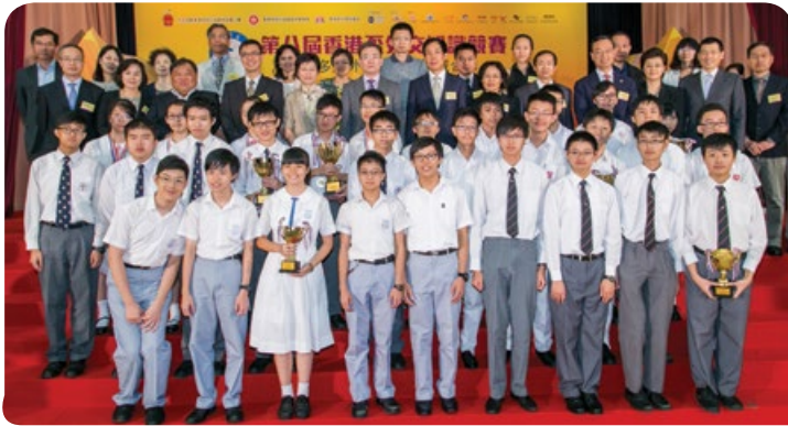
第八屆香港盃外交知識競賽