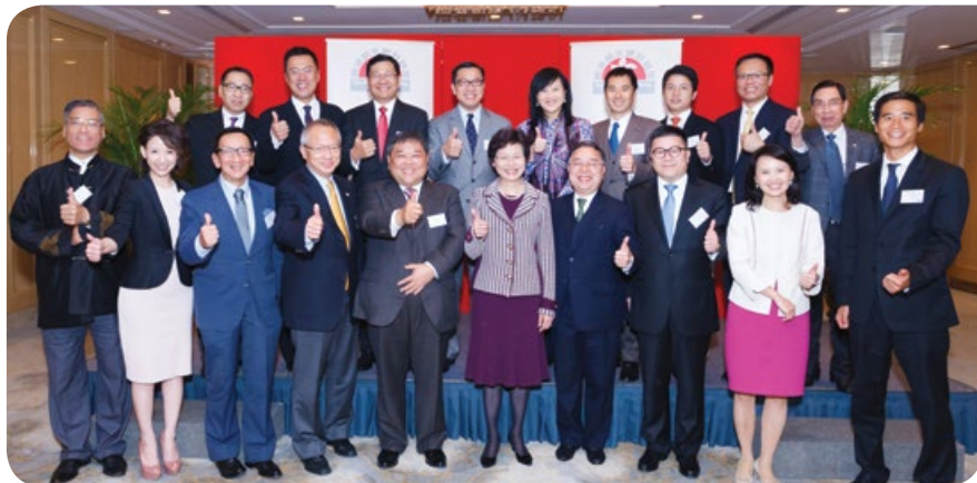
「基金」成員與林鄭月娥司長(前排右五)一同祝願香港的政制發展成功

「基金」每年於新春期間均舉辦午餐會，邀請各國駐港總領事及商會領袖出席，向他們送上節日的祝福，並進行交流。本年的新春午宴於2014年2月27日成功舉行。「基金」執行委員會主席陳啟宗先生及信託人丹斯里 拿督邱達昌聯同多位「基金」理事設宴招待逾七十名嘉賓。「基金」很榮幸邀得政務司司長林鄭月娥女士為主講嘉賓，並以“2017年行政長官及2016年立法會產生辦法的公眾諮詢”為題發表演說。