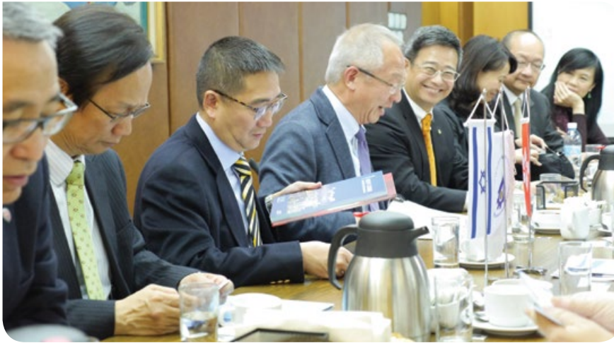
與以色列製造商協會交流