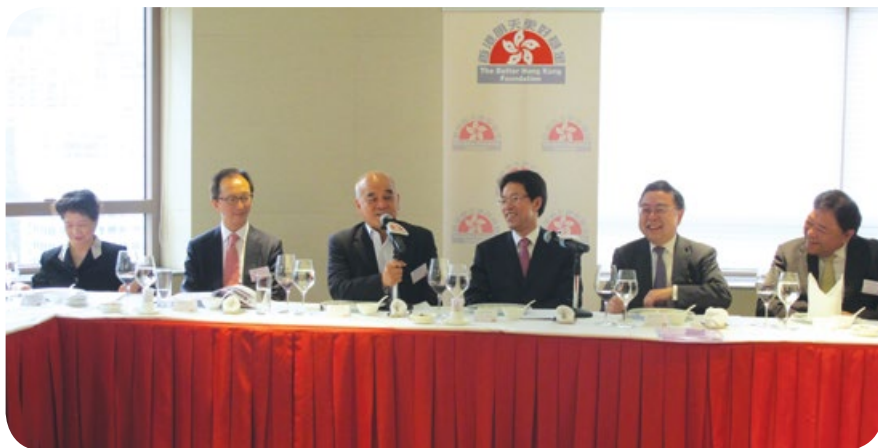
與中聯辦張曉明主任會面

培育人們對不同社會和國度的理解，傳媒擔當著重要的角色。本年度，「基金」再次與中華全國新聞工作者協會及美國東西方中心合作，舉辦第五屆中美記者交流計劃。是次計劃安排五名美國記者訪問北京、寧夏及香港，以及五名中國記者訪問美國