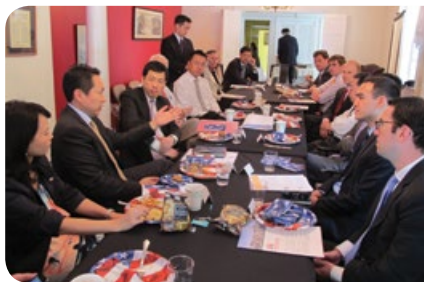
美京美亞協會國會山午餐研討會