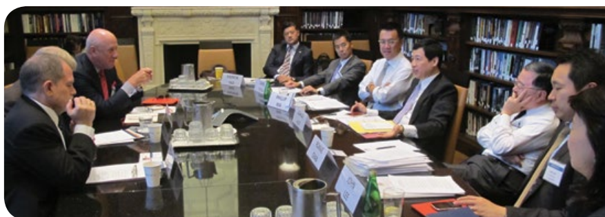
到訪布魯金斯協會