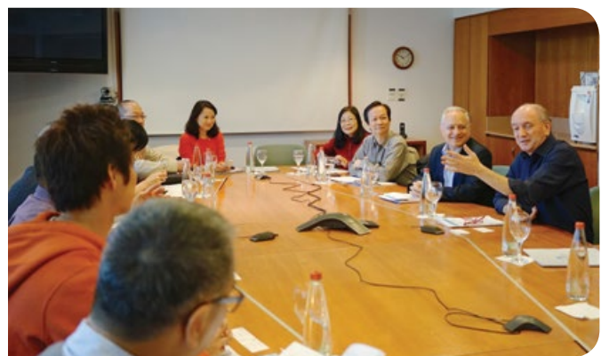
與魏茨曼科學研究學院交流