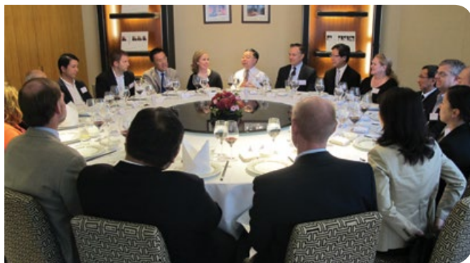
「基金」設午宴款待美國國會議員幕僚訪問團