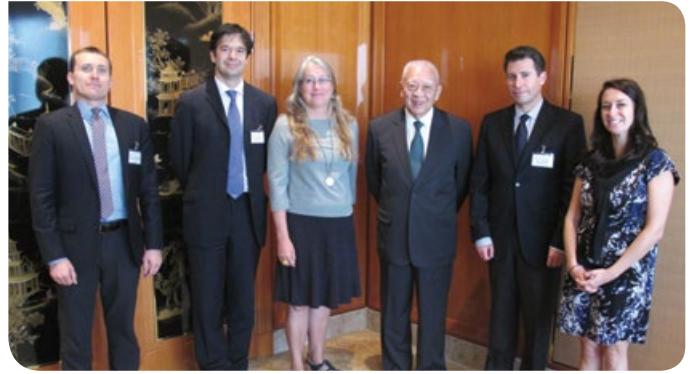
全國政協副主席兼首任行政長官董建華先生(右三)為訪問團安排早餐會