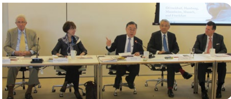
美中公共事務協會早餐會議