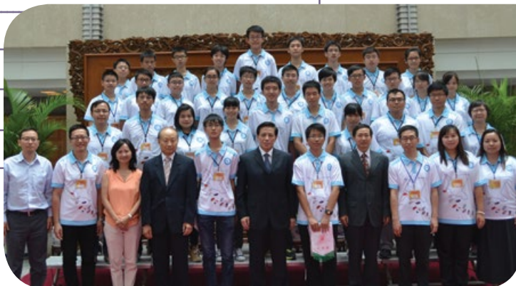
訪問團十分榮幸獲外交部副部長張業遂先生(前排中)、詹永新司長(前排左四)及馬占武副司長(前排右四)親切接見