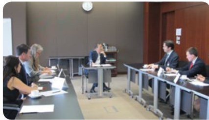
與立法會主席曾鈺成議員會面