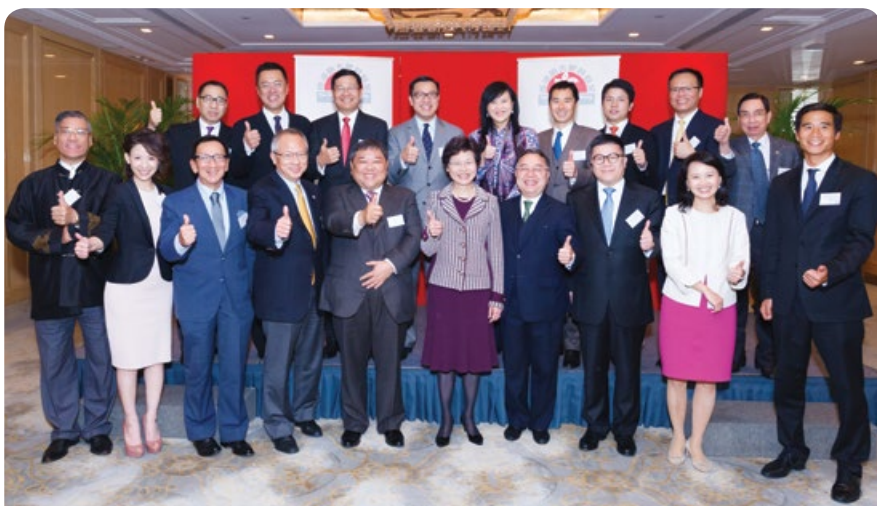
與各國駐港總領事及商會領袖新春午宴

在《滬港通》開通前，「基金」邀得香港交易所集團行政總裁李小加先生向成員講解計劃內容，闡述此創舉如何將香港和上海的股票市場連繫起來，以至進一步協助中國股票市場對外開放及人民幣的國際化。