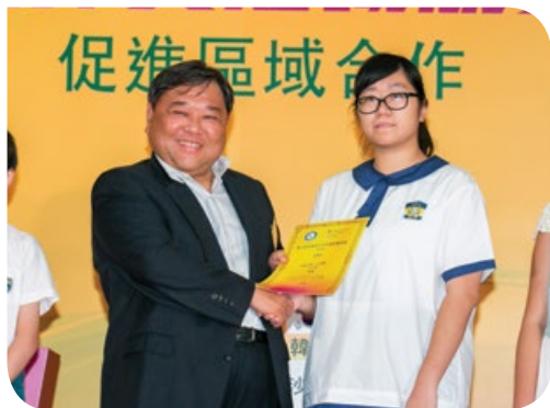
「基金」信託人丹斯里 拿督邱達昌頒發獎狀予T-恤設計比賽冠軍得主

經過激烈比賽後，由保良局董玉娣中學奪得冠軍。約300多名中小學師生出席觀看比賽，對參賽者的出色表現均表讚賞。除競賽外，大會同時舉辦T恤設計比賽，希望吸引更多學生的參與。