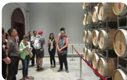
寧夏玉泉營葡萄酒基地