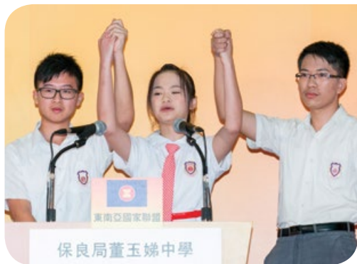
保良局董玉娣中學奪得冠軍殊榮

8月1日至8日期間，大會特別安排優勝及入圍總決賽的隊伍及其老師訪問北京及貴州。訪問團到訪北京外交部，並十分榮幸獲外交部副部長張業遂先生親切接見。透過競賽，我們希望香港的青少年及公眾對中國，特別是國際外交方面更感興趣。