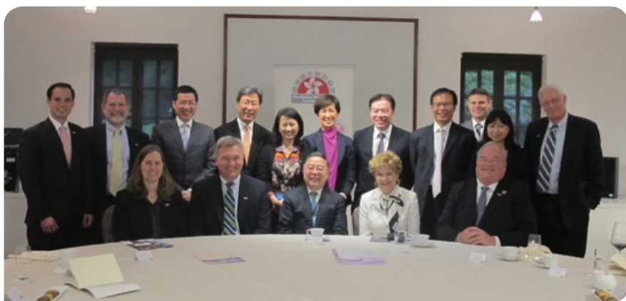
「基金」設晚宴招待美國國會議員Jim Matheson先生(前排左二)、Madeleine Bordallo女士(前排右二)及Billy Long先生(前排右一)