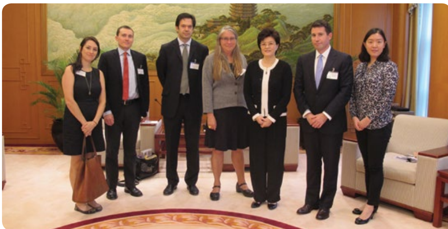
與外交部駐港公署副特派員姜瑜女士(右三)會面

在訪美期間，中國記者會見了當地政府官員、智庫、社區及商界領袖、教育家、記者等，探討不同議題，亦了解更多美國有關人士對中美關係的看法。