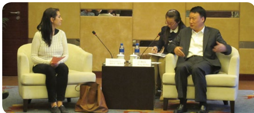
寧夏回族自治區人民政府王和山副主席向訪問團簡介當地發展