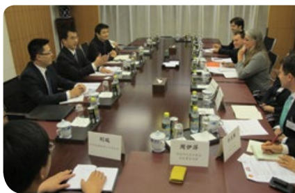
與外交部北美大洋洲司會面

的直接對話，以及親身接觸和了解各方發展，美國記者對香港及中國內地的當前形勢和未來發展都有更深的認識。