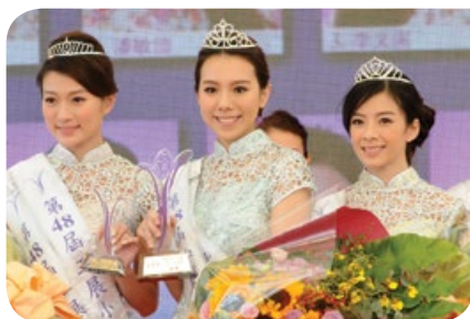
第48屆工展會「集本地品牌 展更好明天」攝影比賽冠軍作品