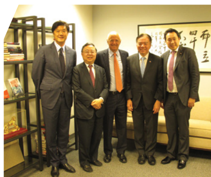
到訪美中關係全國委員會