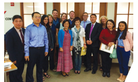
中美記者於華盛頓聚首並交流