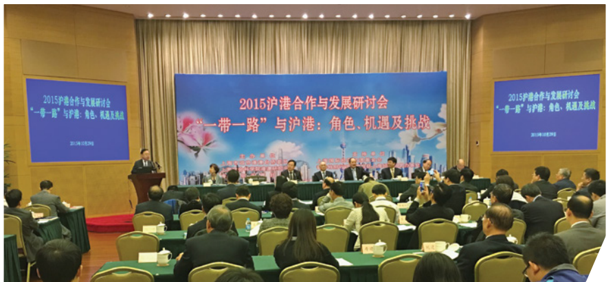
於研討會上討論上海和香港於“一帶一路”的角色