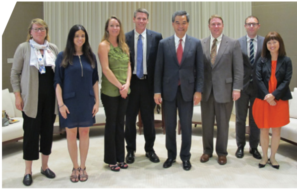
行政長官梁振英先生(右四)接見訪問團