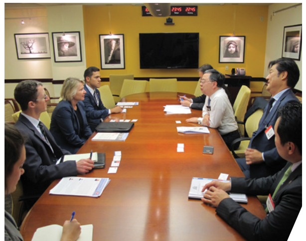
副助理國務卿Susan Thornton女士與訪問團交流