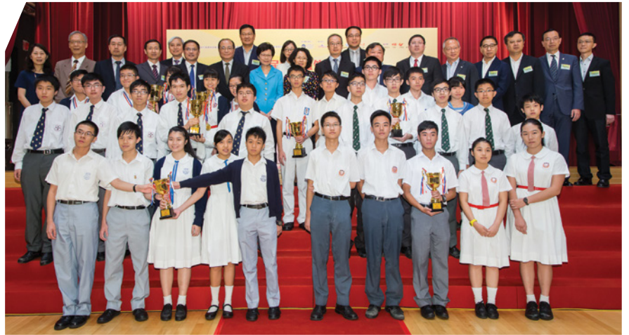
總決賽於7月11日圓滿舉行

本屆競賽獲超過五千名來自六十六間中小學的同學報名參加。經過初賽及準決賽後，最後六強隊伍於7月11日出戰總決賽，爭奪金獎殊榮。比賽中，學生們相互比拼對中國外交事務、