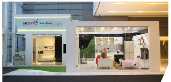
於香港科學園的展覽

活動由香港科學園主辦，「基金」為支持機構，旨在啟發業界及市民大眾共同構創對未來城市的願景，內容包括展覽、會議、研討會、工作坊及比賽等。