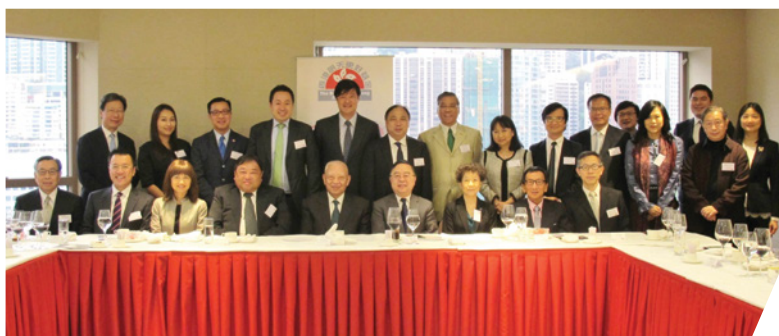
董建華先生(前排中)