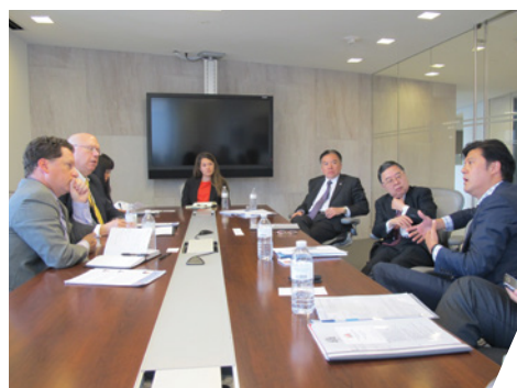
與戰略與國際研究中心代表交流