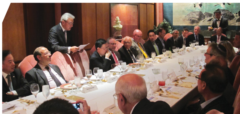
由美中公共事務協會主持，與紐約多個猶太組織晚宴