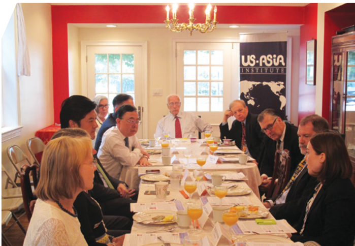
美京美亞協會國會山早餐研討會