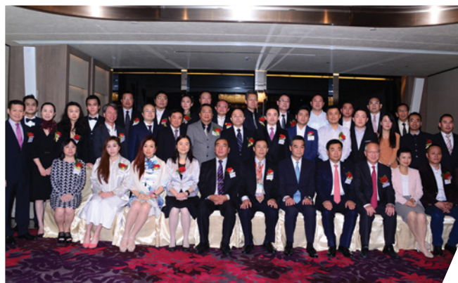
行政長官梁振英先生(前排右五)為閉幕式的主禮嘉賓