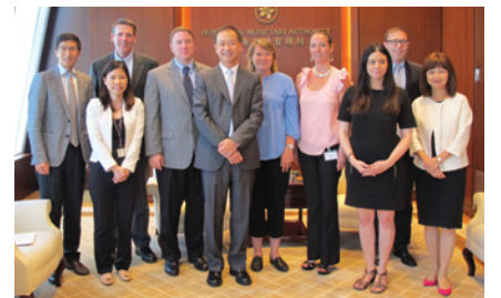
到訪香港金融管理局，與副總裁余偉文先生(左五)會面