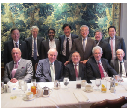
美中公共事務協會午餐會