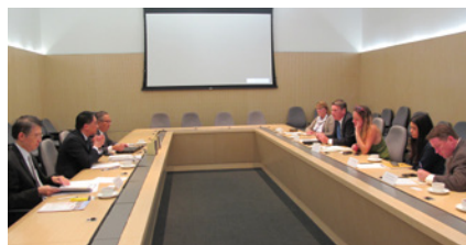
與律政司司長袁國強先生交流