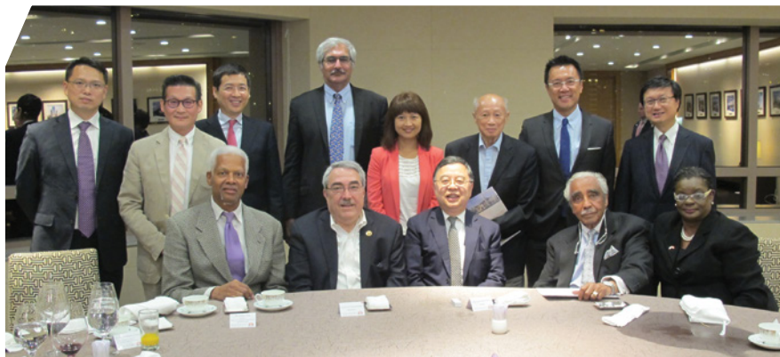
(前排)Henry C Johnson Jr議員(左一)、G K Butterfield議員(左二)、Charles B Rangel議員(右二)及Gwen S Moore議員(右一)