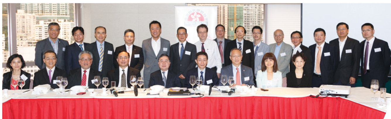
午餐研討會於新聞發佈會前舉行，讓「基金」成員與多位嘉賓就報告內容交換意見及看法

發展的重要性。出席嘉賓包括時任行政長官創新及科技顧問、現任創新及科技局局長楊偉雄先生、行政會議成員及立法會議員葉劉淑儀女士、香港大學城市規劃及設計系系主任葉嘉安教授、前政府經濟顧問郭國全先生及香港工業總會副主席鄭文聰先生等亦於午餐研討會上分享見解。