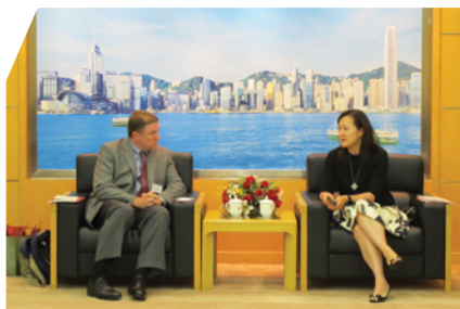
香港特區政府駐京辦接待美國記者