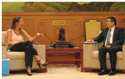
與外交部駐港公署副特派員宋如安先生會面

在訪美期間，中國記者會見了當地政府官員、智庫、社區及商界領袖、教育家、記者等，探討不同議題，亦了解更多美國有關人士對中美關係的看法。