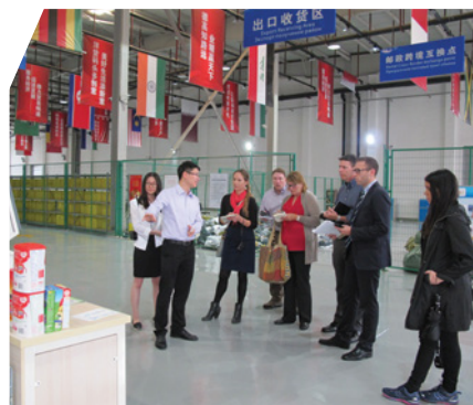
參觀西安國際港務區