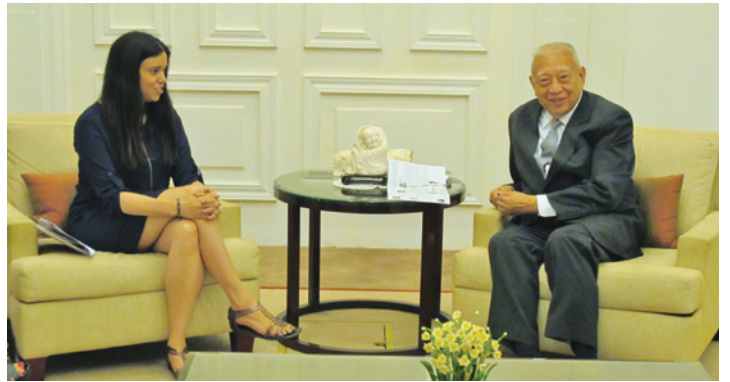
與全國政協副主席兼首任行政長官董建華先生會面