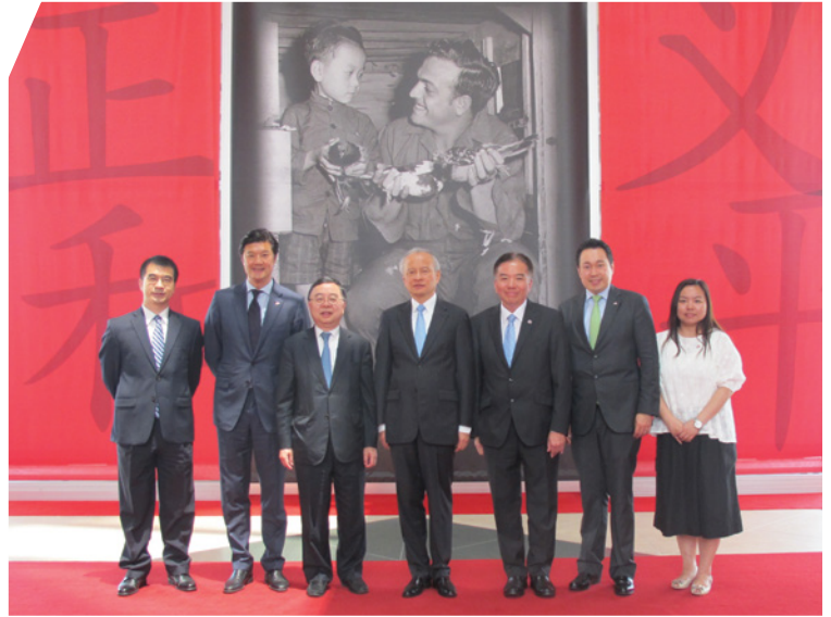
崔天凱大使(中)於中國駐美大使館宴請訪問團