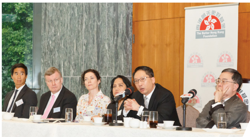
與各國駐港總領事及商會領袖新春午宴