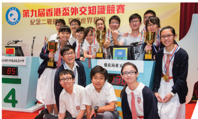
保良局董玉娣中學再次奪得冠軍殊榮