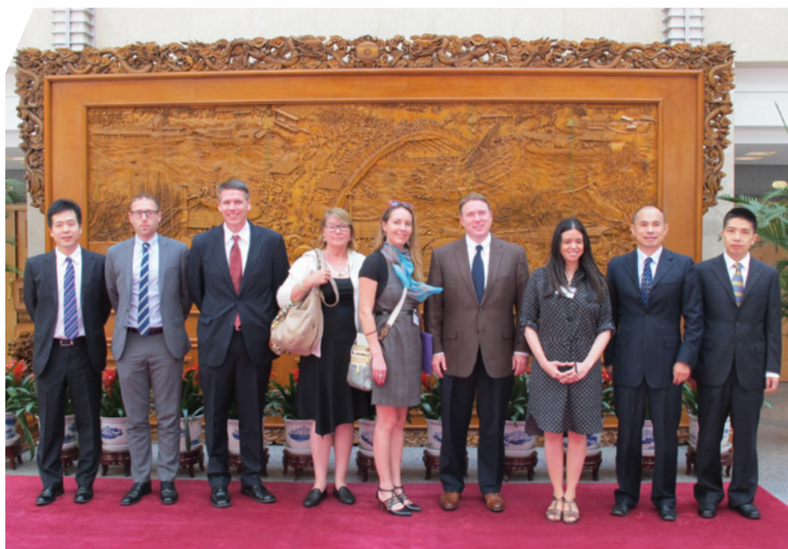
到訪外交部並與新聞司及北美大洋洲司代表會面

為加強美國媒體對中國和香港的認識，「基金」自1996年起每年均會邀請6至8名美國記者訪問中國和香港，並由「基金」贊助及組織有關訪問活動。在中國外交部的支持下，美國記者能夠與北京中央政府的高級官員，以及內地二、三線城市的地方政府官員會面。除向記者介紹及提供訪問城市的概況外，「基金」亦特別邀請當地工商界翹楚、學術及調研機構以及傳媒工作者與記者見面，為他們拓闊地方聯繫。今年，「基金」與中華全國新聞工作者協會(中國記協)及美國東西方中心舉辦第六屆中美記者交流，擴大原有的美國高級記者訪問團，加入中國記者訪問美國的部份。本年度訪問團的主題為「拉近中美之間的認知差距」。