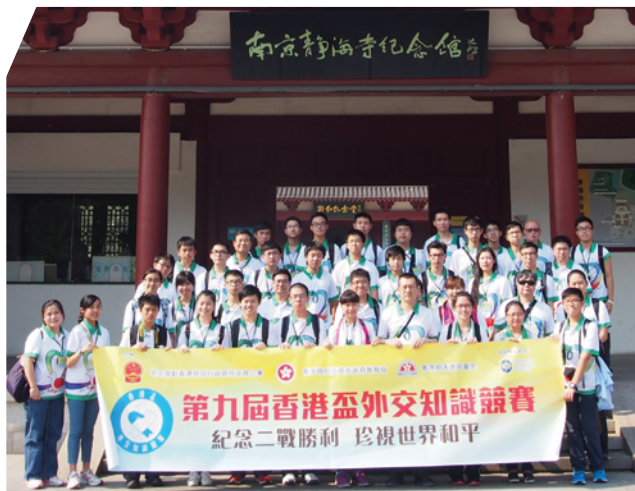
參觀《南京條約》史料陳列館