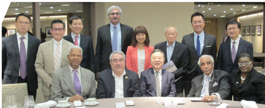
宴請美國非商國會議員訪問團

每年一度的上海會議由「基金」與上海社會科學院及上海市政協共同舉辦，今年探討上海及香港在“一帶一路”的宏圖中如何作出貢獻及