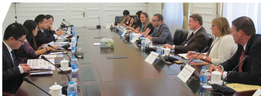
與中國國際問題研究院交流

國紐約及華盛頓。中美記者在完成各自旅程後，於華盛頓聚首並進行交流活動，互相分享彼此在旅程中的所見所聞，更就如何提升及改善雙方媒體的報導交換意見。透過與地方當局和不同社區的直接對話，以及親身接觸和了解各方發展，美國記者對香港及中國內地的當前形勢和未來發展都有更深的認識。