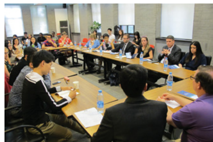
與清華大學新聞與傳播學院導師及學生交流