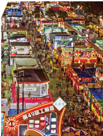
第49屆工展會「萬千品牌 更好明天」攝影比賽冠軍作品

獲「基金」贊助並由香港中華廠商聯合會主辦的第50屆工展會「工展精彩50 共創更好明天」攝影比賽於2015年12月12日至2016年1月4日期間舉行。是次攝影比賽鼓勵市民透過攝影作品展現工展會精彩熱鬧的時刻，認識本地品牌的輝煌成就，提高市民對香港工業的關注。