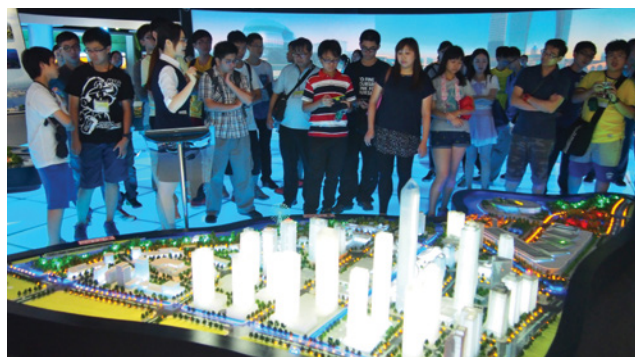
參觀蘇州工業園區