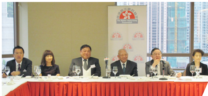
與全國政協副主席兼首任行政長官董建華先生會面

「基金」自成立以來一直致力鼓勵香港、中國內地與世界各地進行對話及交流。於七月舉行的年度訪美團，由執行委員會主席陳啟宗先生率領，到華盛頓及紐約與新知舊友分享及交流彼此對香港、中國內地及美國各議題的看法。剛在習近平主席訪美前，「基金」於九月初安排六位參與中美記者交流計劃的美國資深記者訪問北京、西安及香港。是次計劃由「基金」、中華全國新聞工作者協會及美國東西方中心共同合作，提供難得機會予美國記者親身觀察及了解中國，同時亦讓五名中國記者到訪美國紐約及華盛頓，加深對當地的認識。雖然彼此的誤