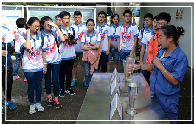
參觀昆明滇池污水處理廠