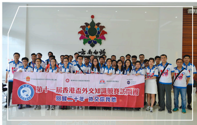
參觀雲南白藥生產基地