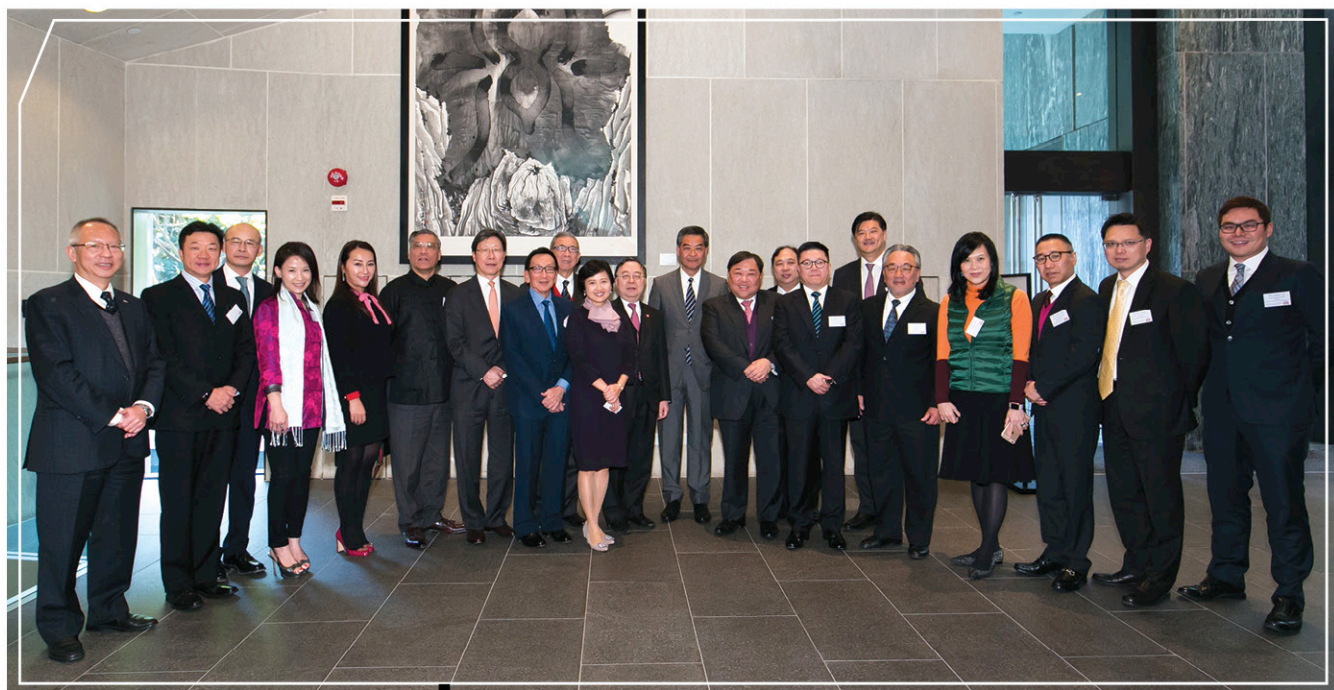
行政長官梁振英先生與「基金」成員