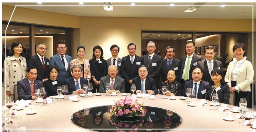
與董建華先生(前排左四)

女士、文肇偉先生、林曉盈女士、梁少康博士、陳明耀先生、陳炎光先生、楊偉誠博士、李鎮國先生、李遠康先生、陳耀璋先生、區妙馨女士及史立德博士，及嘉賓董趙洪娉女士、譚慧雲女士及史顏景蓮女士。