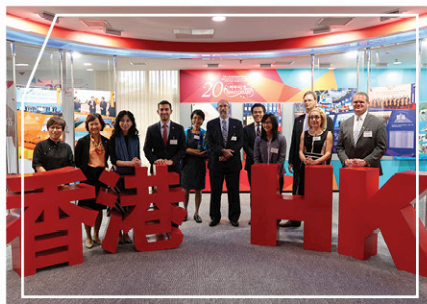
到訪香港特區政府駐京辦