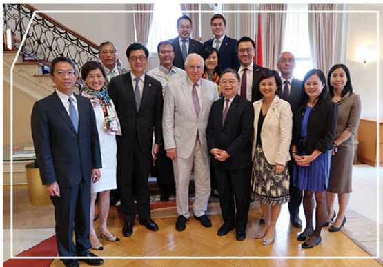
與香港駐美國總經濟貿易專員梁卓文先生(左一)及Stapleton Roy大使(前排左四)於香港駐華盛頓經濟貿易辦事處會面