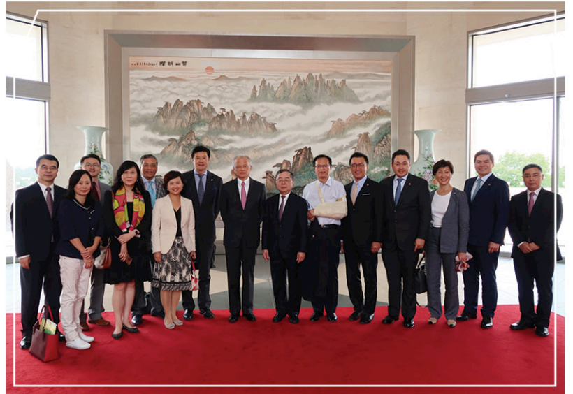
崔天凱大使(中)於中國駐美大使館內宴請訪美團