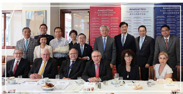
與猶大組織領袖會面交流