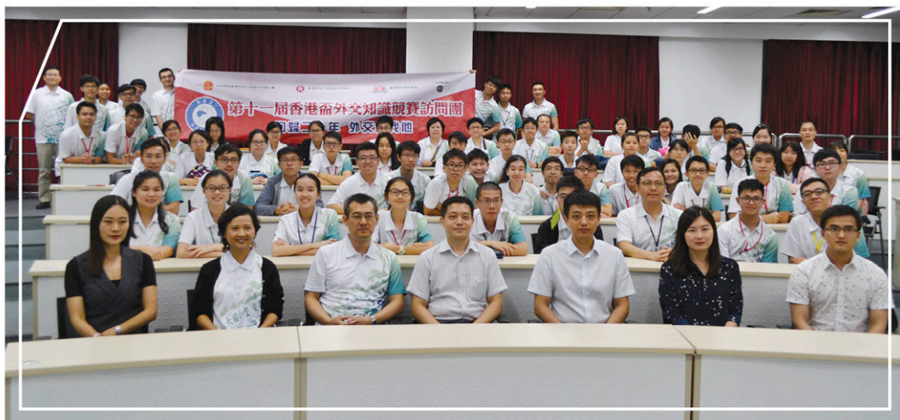
同學們到訪外交部與青年外交官交流

於7月30日至8月5日，大會安排中學組優勝隊伍訪問北京及昆明。旅程中的重點活動是到訪北京外交部，與多名青年外交官交流。透過競賽，我們希望香港的青少年及公眾對國際外交，特別是中國方面更感興趣。