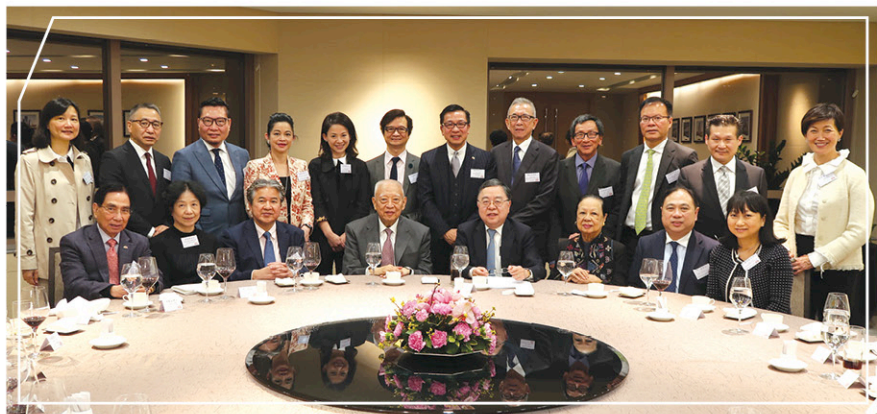
與全國政協副主席兼首任行政長官董建華先生會面

科技、人工智能和物聯網發展一日千里，不少人認為它們帶來“干擾”，但同時亦有很多人將之化為無限機會。我們如何理解及面對這趨勢，採取抗拒還是採納的態度，去掌控還是隨波逐流，不同的取態將塑造出不一樣的未來世界。我期望有更多智者能積極善用它：有效地用之於改善人民福祉，縮窄社會內及國際間之財富和資源差距，著力創造和諧的社區及和平的世度。