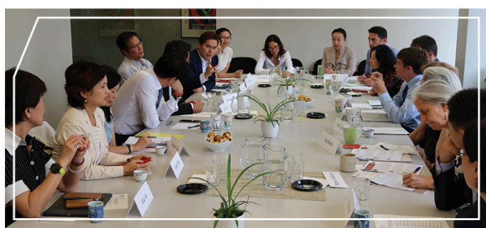
訪美團與美中關係全國委員會所邀請的專家交流