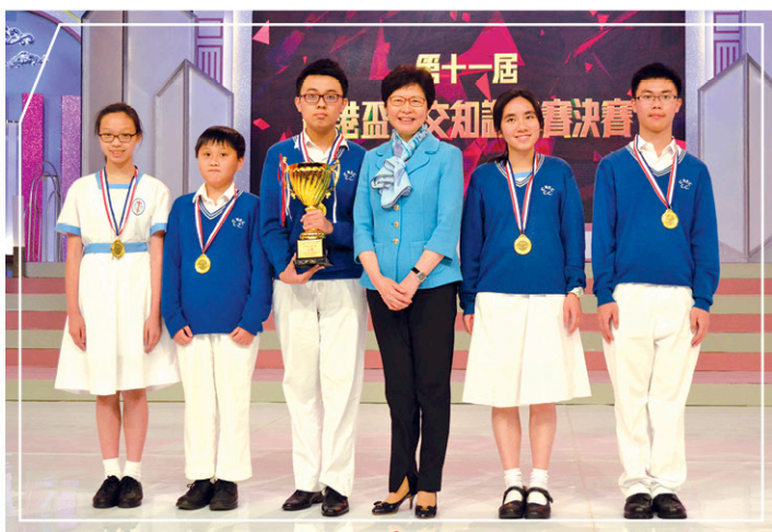
第十一屆香港盃外交知識競賽

「基金」於1995年成立，慶祝香港回歸祖國。自特區成立20年以來，香港一直繁榮發展。我們應珍惜所取得的豐碩成就，並努力使我們的城市、國家以至世界變得更美好。只要大家相互信任、彼此支持及同心協力，我們的願望定能實現！