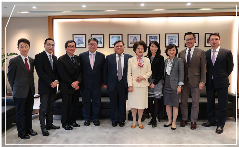
與馬克卿大使(右五)