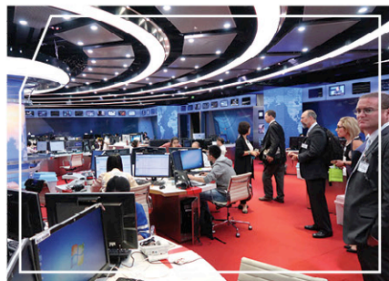
參觀中國中央電視台工作室