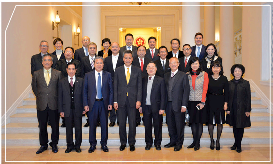
行政長官梁振英先生及「基金」成員於禮賓府會面

「港珠澳大橋」及「廣深港高速鐵路」將於2018年落成，勢增強兩地基建的互通，更有利香港在「粵港澳大灣區」（“大灣區”）發展計劃下，一個以成為世界級科技和商業都會區中爭取更多更大的機遇。此外，在“一帶一路”的宏大倡議下，以及作為亞洲基礎設施投資