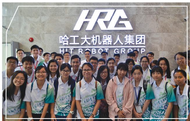
參觀哈工大機器人集團