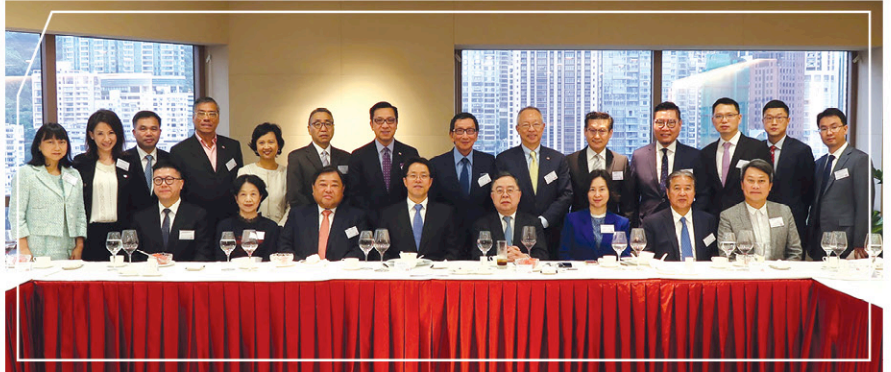
與中央人民政府駐香港特別行政區聯絡辦公室主任張曉明先生會面

「基金」向來鼓勵我們的年青人既要有國際視野，亦要了解我們的國家。由「基金」、外交部駐香港特別行政區特派員公署及香港教育局合辦的香港盃外交知識競賽，正好有助中、小學生增強他們對國際事務及國家外交政策的認識。今年的優勝隊伍獲安排前往北京及昆明參訪。當同學們參觀中國疾病預防控制中心時，聽到幾位年輕醫生分享他們冒著生命危險參與海外醫療人道救援的工作，大家都深受感動。而參觀哈工大機器人集團