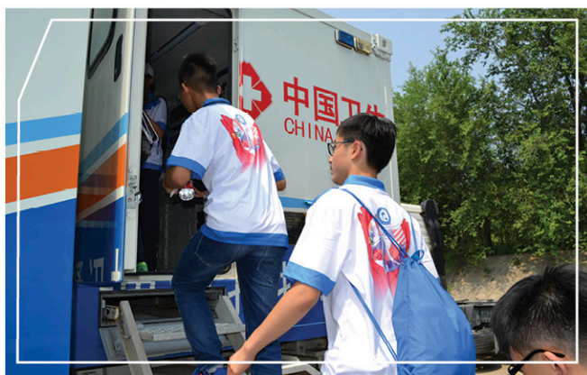
參觀中國疾病預防控制中心