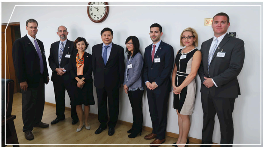
與財政部副部長朱光耀先生(左四)會面

為加強美國媒體對中國和香港的認識，「基金」自1996年起每年均會邀請6至8名美國記者訪問中國和香港，並由「基金」贊助及組織有關訪問活動。在中國外交部的支持下，美國記者能夠與北京中央政府的高級官員，以及內地二、三線城市的地方政府官員會面。除向記者介紹及提供訪問城市的概況外，「基金」亦特別邀請當地工商界翹楚、學術及調研機構以及傳媒工作者與記者見面，為他們拓闊地方聯繫。今年，「基金」與中華全國新聞工作者協會(中國記協)及美國東西方中心舉辦第八屆中美記者交流，擴大原有的美國高級記者訪問團，加入中國記者訪問美國的部份。本年度訪問團的主題為「拉近中美之間的認知差距」。