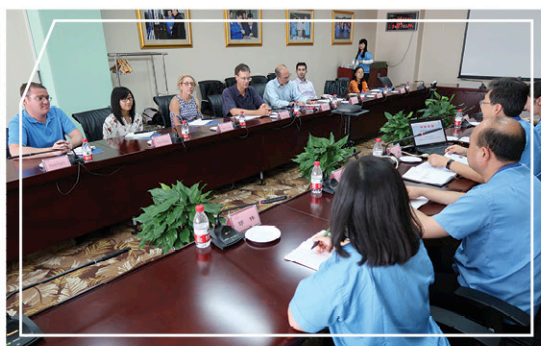
與陝西法士特汽車傳動集團公司代表會面