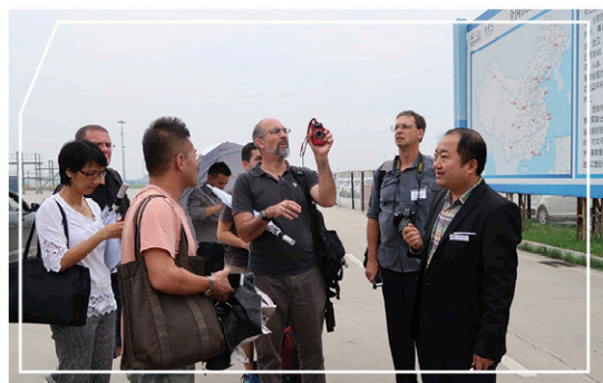
參觀西安國際港務區