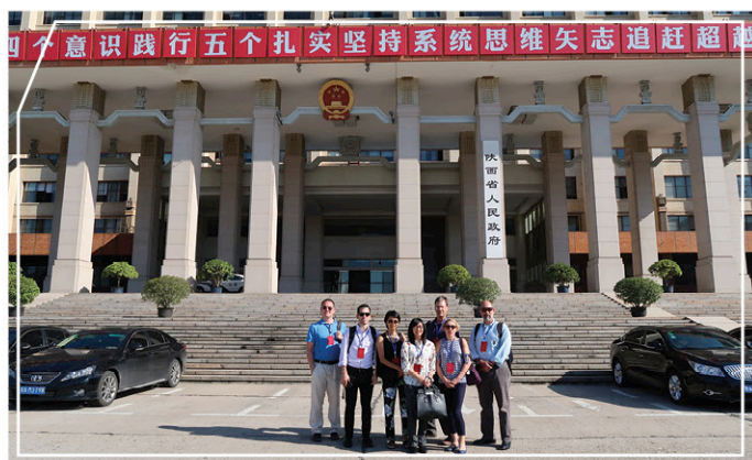
參觀陝西省人民政府辦公樓