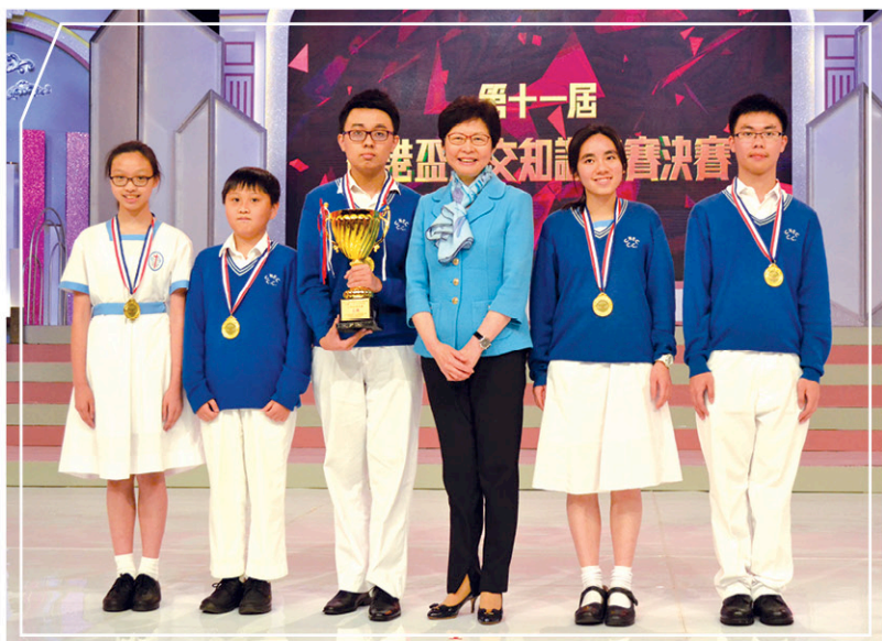
候任行政長官林鄭月娥女士(右三)頒發精英賽金獎予中華傳道會安柱中學

先鋒賽的金獎分別由中華傳道會安柱中學及聖言中學奪得。決賽假無線電視舉行並進行錄影，約四百多名師生代表現場觀看是次比賽，而有關的特備節目亦於5月21日於無線電視台播出。此外，大會同時舉辦貼紙設計比賽，吸引更多學生參與。