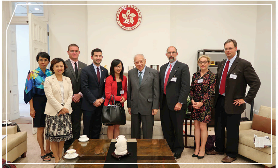
與全國政協副主席兼首任行政長官董建華先生(右四)會面