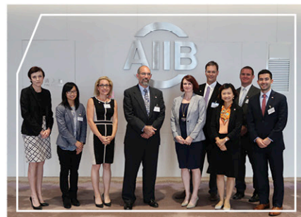
與亞洲基礎設施投資銀行代表會面