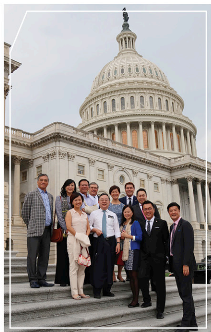
前國會議員Jack Fields帶領訪美團夜遊國會山莊