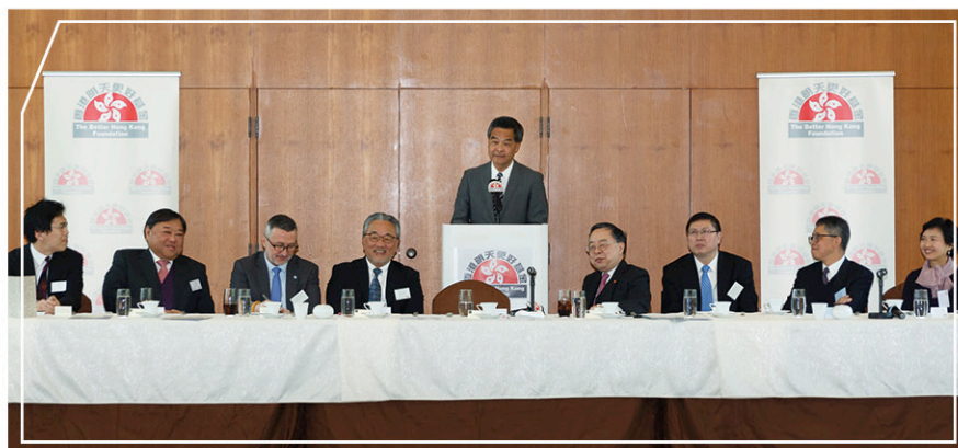
行政長官梁振英先生發表演說