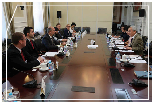
中國國際問題研究院副院長榮鷹教授(右)與記者交流