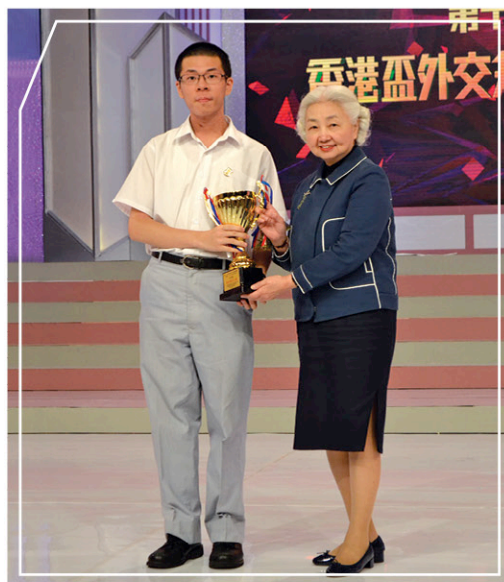
香港基本法委員會副主席梁愛詩女士頒發最佳發言人獎