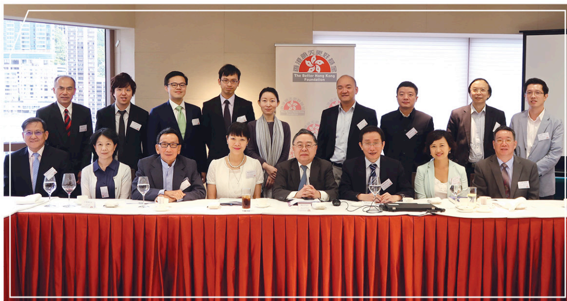
午餐研討會於新聞發佈會前舉行，讓「基金」成員與多位嘉賓就報告內容交換意見及看法

技等新興產業，促進產業多元化及轉型升級，擴大和加強對外經貿關係，從而拓展新的增長源泉。香港的宜居競爭力及可持續競爭力排名全國首位，「知識城市」發展步伐需持續。香港的競爭力雖處於領先地位，但需要居安思危，並認清全球經濟格局變化，通過進行經濟轉型和建立新型全球城市，以更好地適應新的發展環境和抓住機遇。