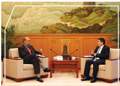
外交部駐港公署副特派員宋如安先生(右)接見訪問團