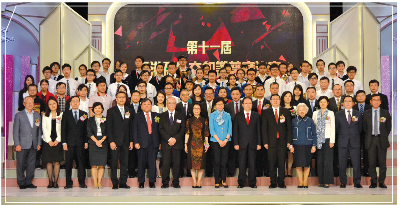
決賽於5月13日完滿舉行

政區成立二十週年的活動之一。本屆競賽共吸引來自全港96所中、小學，逾一萬三千名同學報名參加，為歷來最高數目。