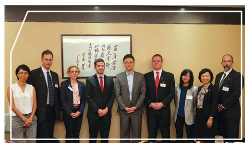
外交部新聞司副司長劉晉先生(中)宴請訪問團